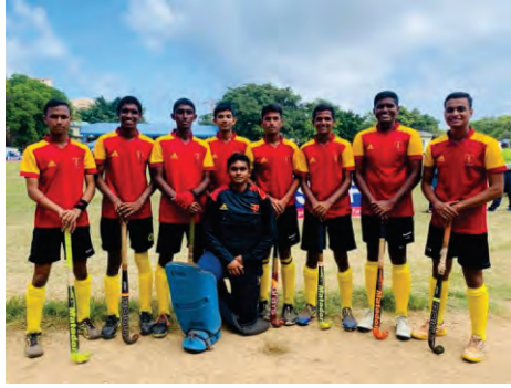
Blue and Gold Hockey Sevens 2023, U19 All Island Schools Hockey 7s Tournament Organized by Royal College, Colombo. Ananda College won the Plate Championship