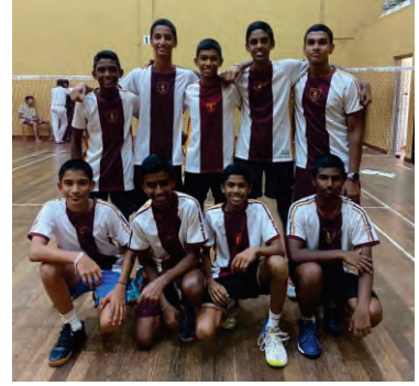
The Under 16 Badminton team of Ananda College has emerged as the Runners up of the National Schools Western Province Badminton Championship 2023