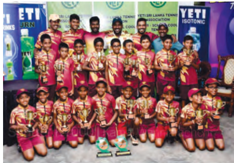
Ananda Tennis Green Ball - A & Orange Ball - A Teams emerged victorious, becoming the champions at the All Island Tennis Championships 2023.