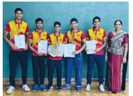
Ananda College U18 table tennis team won the national schools table tennis championship.