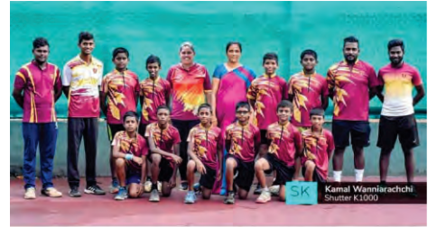
ALL ISLAND INTER SCHOOL UNDER 13 DIVISION 1 TENNIS CHAMPIONS ANANDA COLLEGE - A TEAM