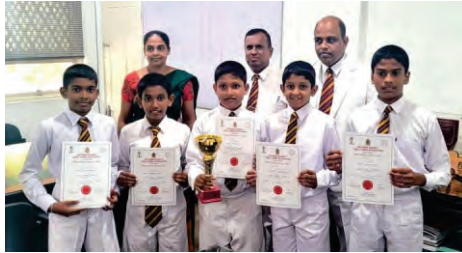
Ananda Table Tennis ,Under 12 Inter School A Division Champions 2023