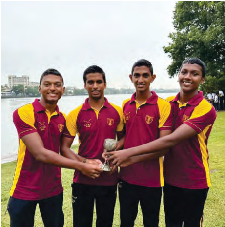
Ananda College won the Vanlangenberg Trophy at the Colombo Rowing Club Opening Regatta 2023.