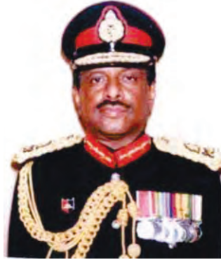
විශිෂ්ට ආදි ආනන්දියකු වූ හිටපු යුධ හමුදාපති ලයනල් පියනන්ද බලගල්ල මහතා වසර 76 ක තම දිවිසැරිය කිමකොට පසුගිය ඔක්තෝබර් 26 වෙනිදා දැයට සමුදුන්නේය. එතුමා ශ්‍රී ලංකා යුද්ධ හමුදාවේ 16 වන යුධ හමුදාපතිවරයා විය.