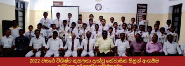
2022 වසරේ විශිෂ්ට කුසලතා දැක්වූ සේවාසික සිසුන් ඇගයීම