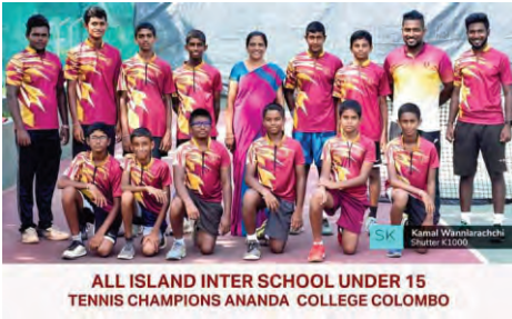
ALL ISLAND INTER SCHOOL UNDER 15 TENNIS CHAMPIONS ANANDA COLLEGE COLOMBO