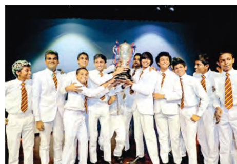
Ananda College emerged victorious as the All-Island Shakespeare drama competition 2023 for delivering an emotional performance of Macbeth.