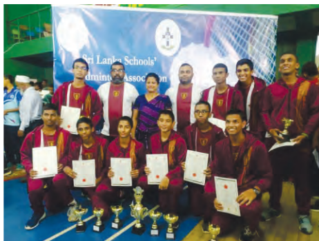
Our Under 17 A Team emerged Champions at the all Island Under 17 Badminton tournament held in Bandarawela